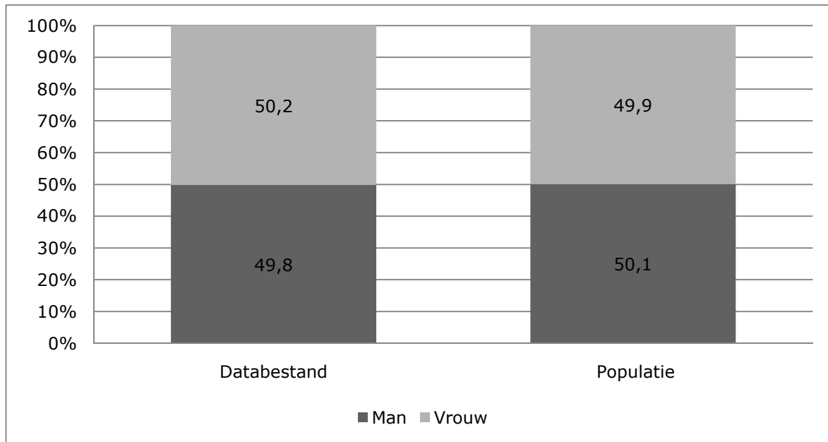
Figuur 1: Vergelijking databestand (N=500) en populatie (N=56204) naar geslacht

Uit figuur 1 blijkt dat het percentage mannen en vrouwen in ons databestand nagenoeg identiek is aan de percentages uit de populatie ( \chi^2=0,018 ; df=1 ; p=0,893 ). De interviewers zijn er met andere woorden goed in geslaagd om respondenten uit de effectieve steekproef die niet konden of wilden meewerken, te vervangen door respondenten uit de reservesteekproef van hetzelfde geslacht.