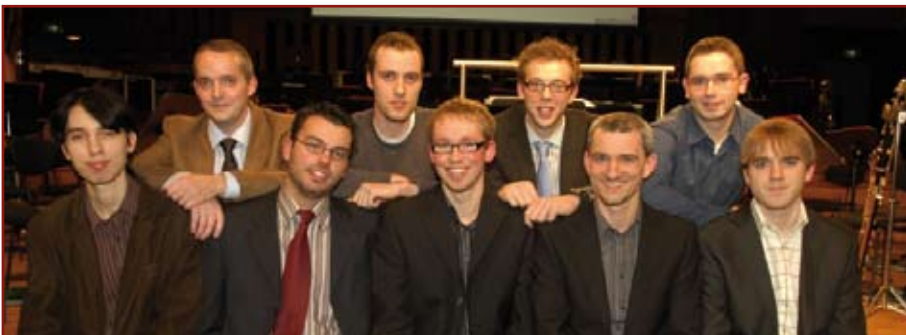
Alle genomineerden 2008.

'Character rigging' of 'articulatie' is het proces waarbij een personage in een 3D-animatiefilm wordt voorgesteld door een model dat kan worden geanimeerd en waarbij een intuïtief controlemechanisme voor de animator wordt voorzien. In plaats van alle beweegbare onderdelen van het personage individueel te manipuleren wordt een structuur aan het model toegevoegd waardoor de animator controle heeft over het verplaatsen van handen, het buigen van spieren, of zelfs het beheersen van emoties van het personage.