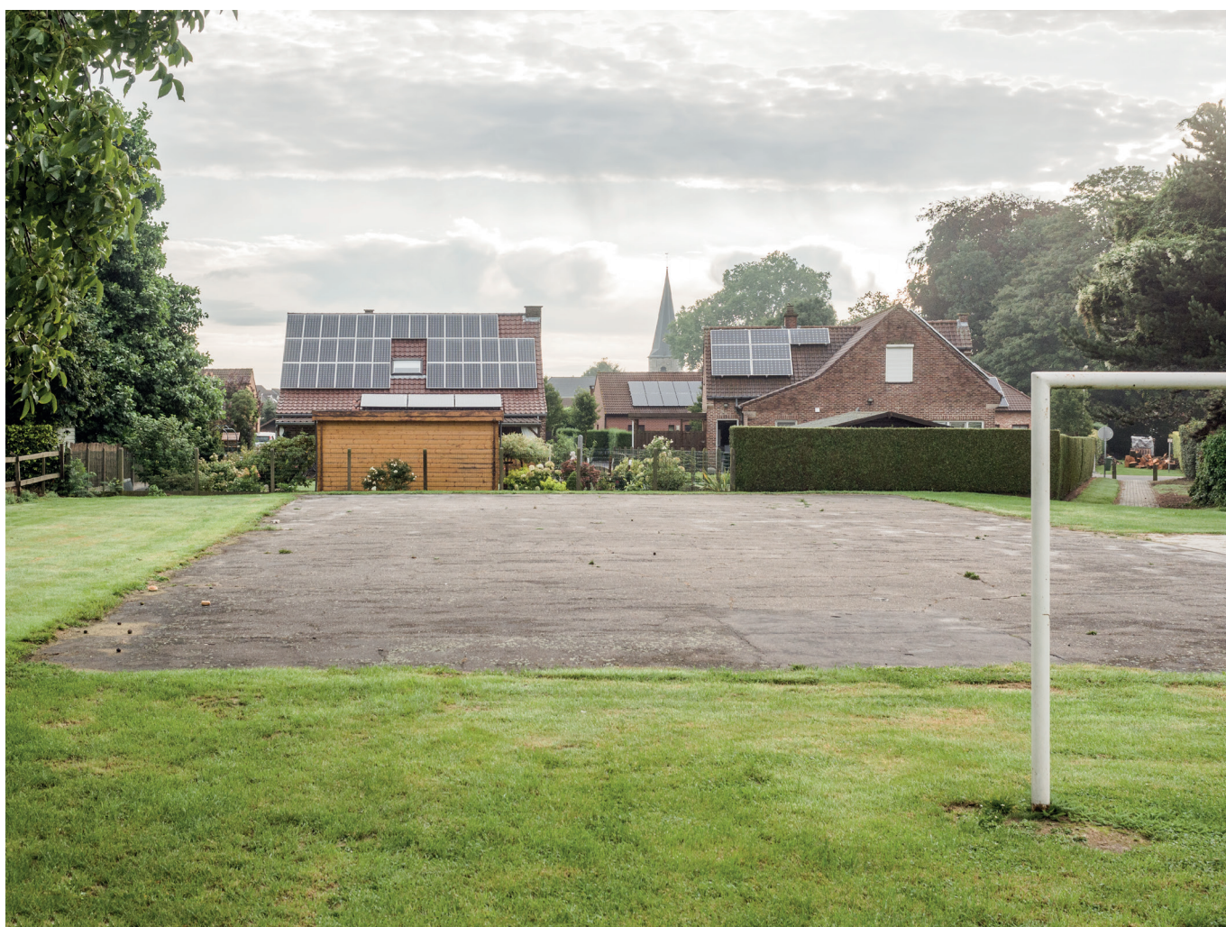
Verkavelingswijk, Hoepertingen

Met de reeks 'Projecties' bieden het Vlaams Architectuurinstituut en deSingel het bestaand onderzoek in Vlaanderen een podium. Leidraad bij de keuze van de projecten zijn maatschappelijke thema's en het bevragen van de rol van de discipline architectuur in de samenleving.