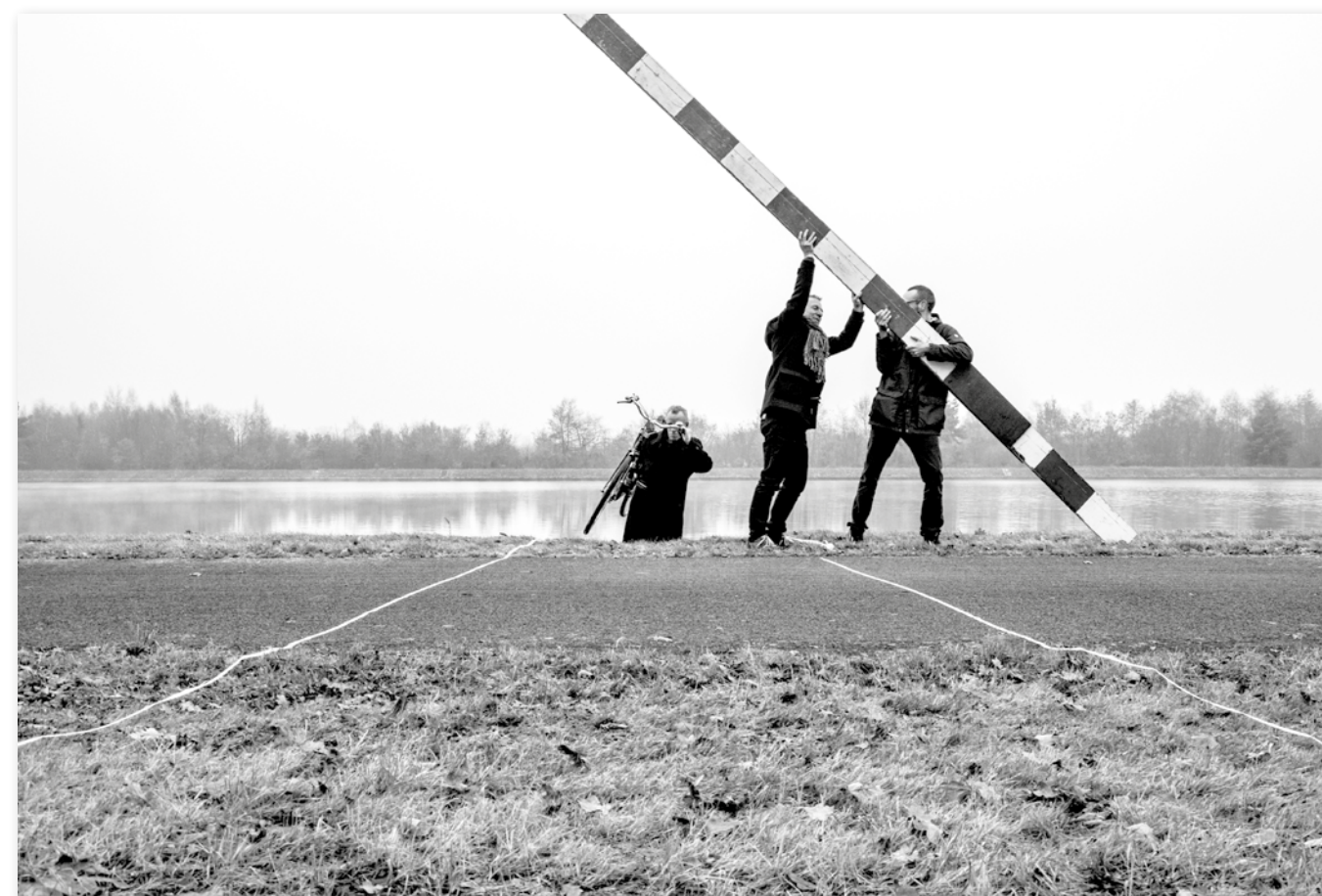
Bewoners simuleren noodzakelijke brug aan het kanaal van Godsheide.

De opening van het buurthuis in de oude kerk geeft dus het startschot voor grootse plannen. Genoeg redenen om de overschotten van de miswijn te kraken.