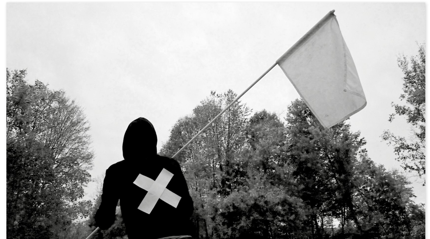
Bewoners heisen witte vlag op de stiltepicknick.

Met een stiltepicknick namen de bewoners op zondagochtend 1 december de golfterreinen van Godsheide in. De omliggende ruimte werd door diverse ontwikkelaars de laatste jaren volgebouwd, zonder aandacht voor de ontwikkeling van open ruimte. Vandaag zijn het vooral de bewoners zelf die de inrichting van de open of rest-ruimte op zich nemen en afspraken maken rond parkeren, speelstraten en gemeenschappelijke tuinen. Met deze stiltepicknick willen ze een gesprek openen met ontwikkelaars en beleid over het gebruik van de groene ruimte rond het golfterrein als speelplek en parkzone.