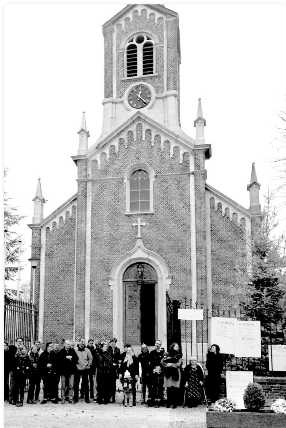
Bewoners vieren de opening van hun buurthuis in de oude kerk.

DE INWONERS EN HET BELEID KEUREN SAMEN NIEUWE BESTEMMING GOED IN GODSHEIDE.