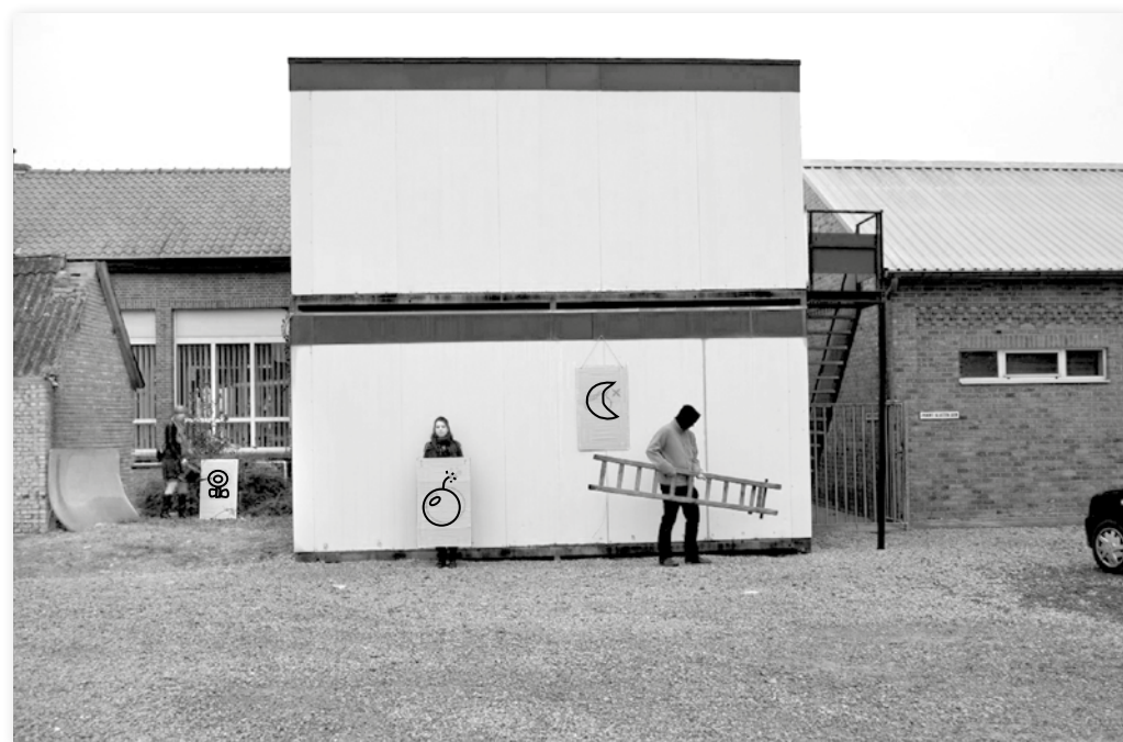
De bewoners plaatsten in 2014 een bom onder de manier waarop de school werd onderhouden.

Tien jaar na de instorting van de buurtschool in Godsheide, vond gisteren een feestelijke opening plaats van de nieuwe klasjes. Hiermee komt er een einde aan het verblijf van kinderen en leerkrachten in de scoutslokalen. De bouw van de nieuwe school werd mogelijk door de crowdfunding initiatieven van het sterke verenigingsleven in Godsheide. De idee achter crowdfunding is dat veel mensen een klein bedrag investeren en dat al die kleine investeringen samen het project volledig financieren.