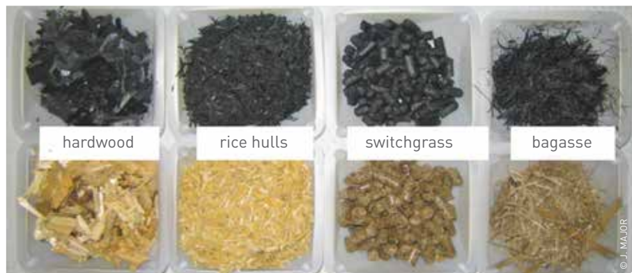
Diverse vormen van organisch materiaal kunnen door ze te verhitten tot temperaturen van 450 tot 550 °C, in afwezigheid van zuurstof, verkolen en worden omgezet naar biochar.

Door organisch materiaal te verhitten tot temperaturen van 450 tot 550 °C, in afwezigheid van zuurstof, zal het materiaal verkolen en wordt het omgezet naar biochar. Dit proces noemt men pyrolyse. Het pyrolyseproces kan worden gevolgd