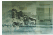
IN THE BACKGROUND LIES THE REAL DESIRE

STAALKAART #35 DECEMBER 2016-JANUARI-FEBRUARI 2017