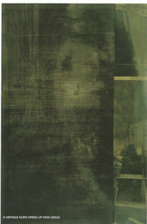
A VINTAGE NUDE OPENS UP NEW AREAS

STAALKAART #35 DECEMBER 2016-JANUARI-FEBRUARI 2017