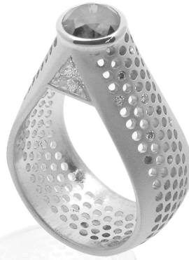
Grid Collection, Salima Thakker