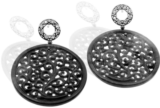
Facet Collection, Salima Thakker