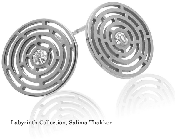
Labyrinth Collection, Salima Thakker