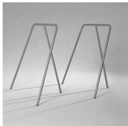
Jumpy, Peyman Nadirzadeh.