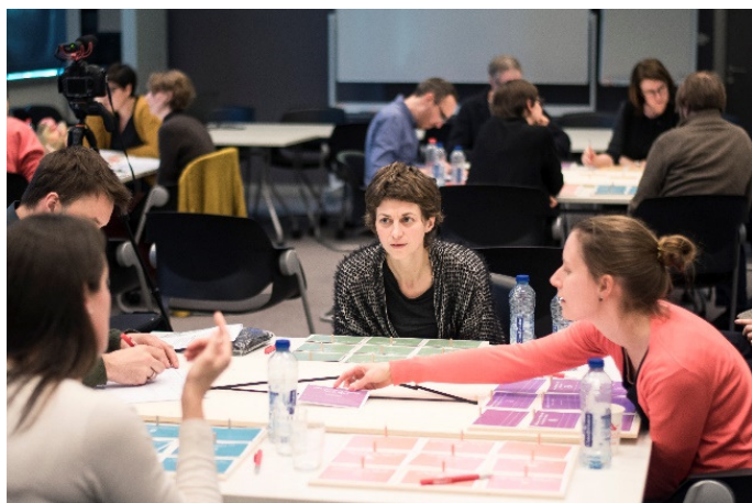
Figuur 1 Leertraject voor Ruimte Vlaanderen