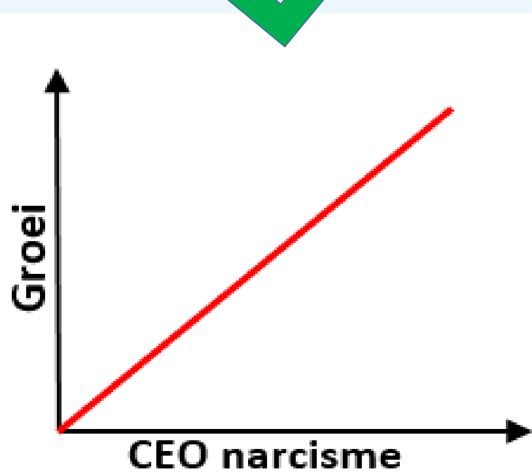
CEO narcisme & groei