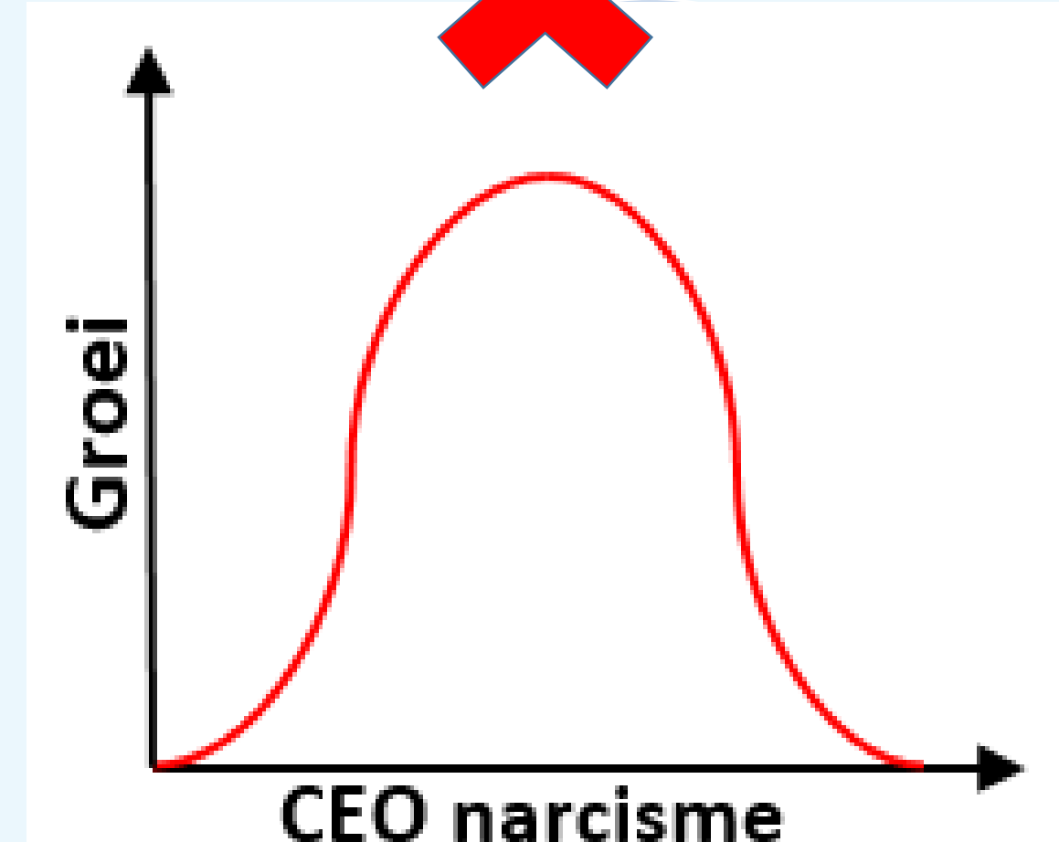
Niet-lineair verband CEO narcisme & groei