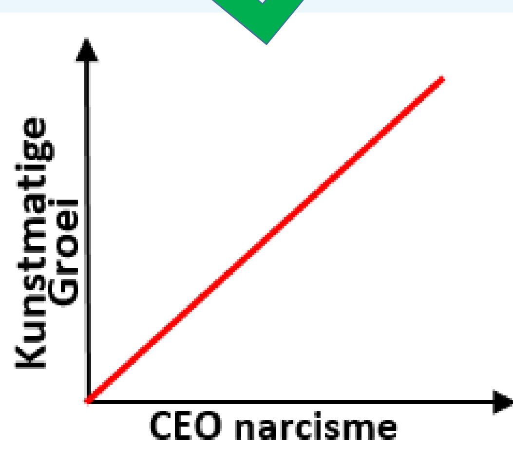
CEO narcisme & kunstmatige groei