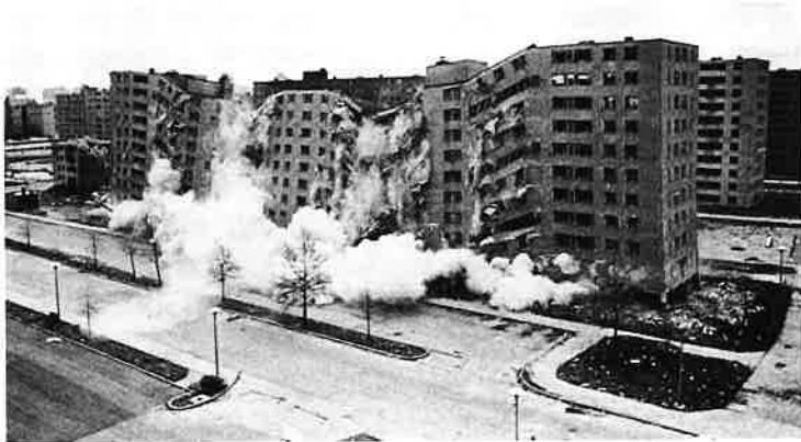
Afb. 36, Minoru Yamasaki, Pruitt-Igoe, Saint Louis, U.S. (1954-1956)