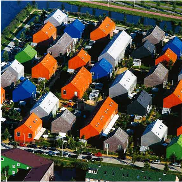
Afb. 40, MVRDV, Ypenburg, Den Haag (1998-2005)

in maatschappelijke processen, kan de architect ook in de huidige invulling van zijn beroep alternatieven bieden voor de ruimtelijke verschijningsvorm van de ongelijkheid. Dit bewijst het Nederlandse architectuurbureau MVRDV met het Waterwijk huisvestingsproject gelegen in Ypenburg, Den Haag. Zij hebben Waterwijk, een nieuwe wijk die uit een aaneengeschakelde groep eilandjes bestaat, mogen ontwerpen. Elk eiland bestaat uit een verschillende