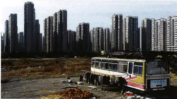
Afb. 37, near newly-constructed residential buildings, Hefei, Anhui province (2012)

de kern van het probleem ons economisch systeem is.