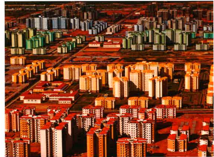
Afb. 38, China International Trust and Investment Corporation (CITIC), Nova Cidade de Kilamba (2012)

2015). Tijdens de studiereis naar Tanzania, die ik in het academiejaar 2015-2016 deed, bezochten we Dar es Salaam. In deze stad in volle transformatie, is de invloed van de Chinese neokolonialisten ook te merken. Zo vormen hun gloednieuwe glanzende torens een sterk contrast met de nog niet ontwikkelde delen en barst het er van de Chinese investeerders.