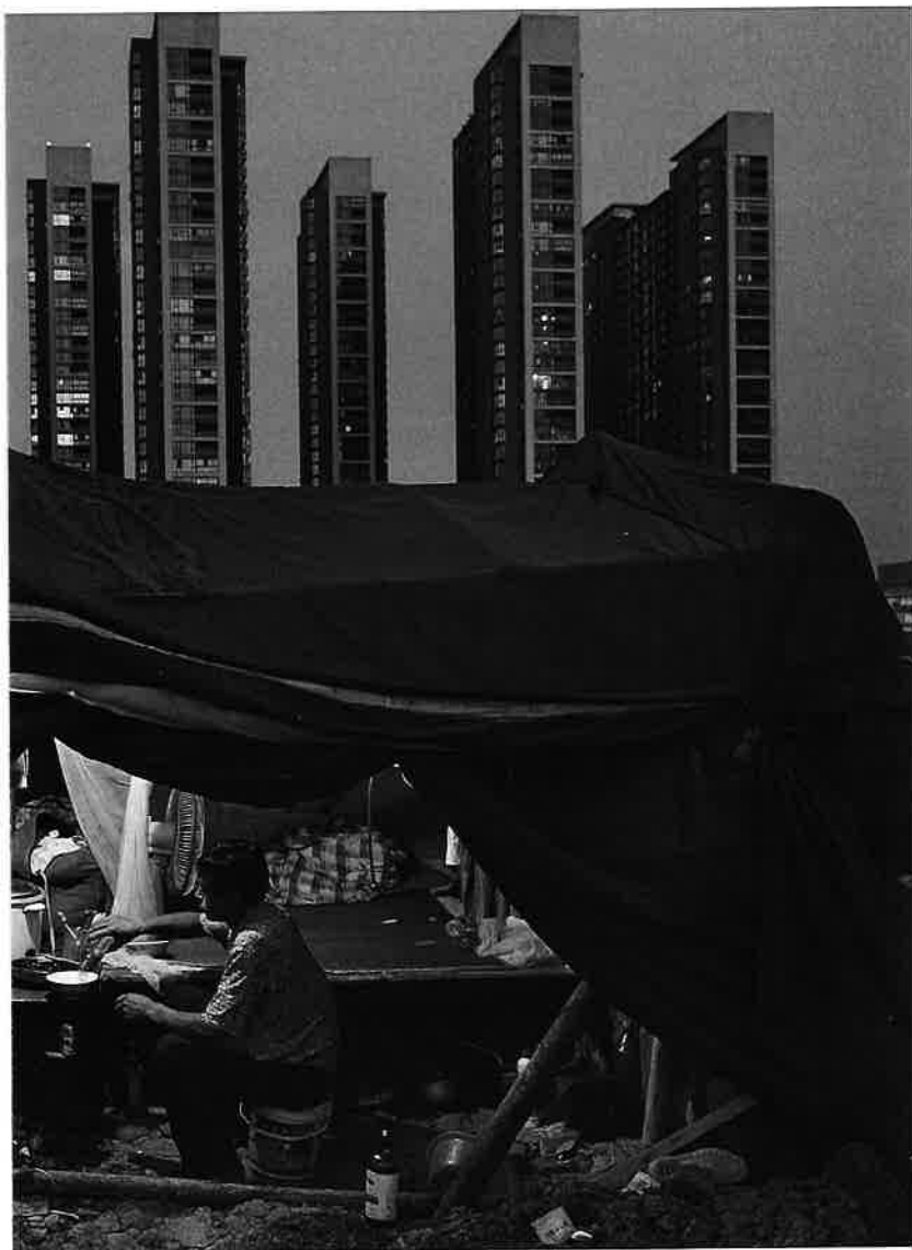
Afb. 30, Een arbeider die aan het dineren is op de werf van een residentieel complex, Hefei, China (08.02.2012)