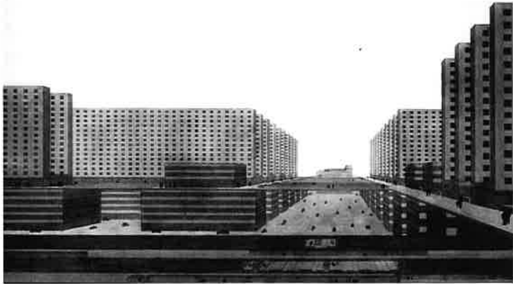
Afb. 34, Ludwig Hilbersheimer, Hochhausstadt, (1924). Noord-zuid straat