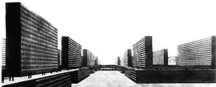
Afb. 35, Ludwig Hilbersheimer, Hochhausstadt, (1924). Oost-west straat