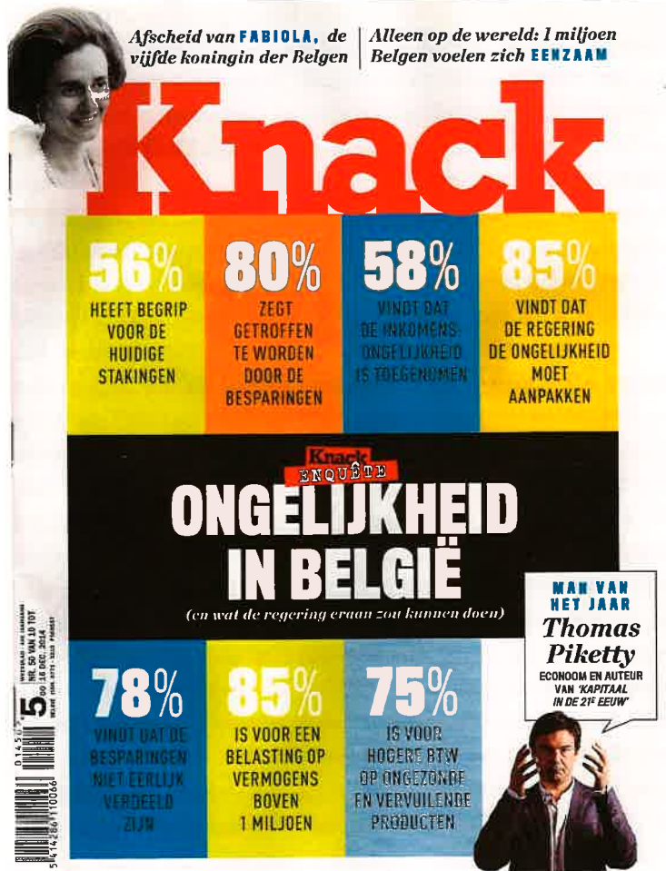
Afb. 31, Knack, Knack cover 10.12.2014 (2014)