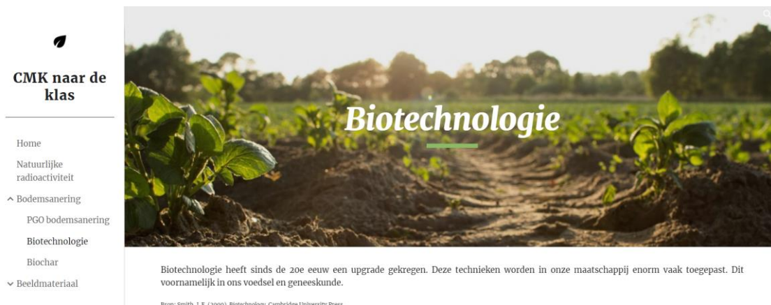
Figuur 7 Pagina biotechnologie van de ontwikkelde website.

Het lesmateriaal rond biotechnologie voldoet aan de verwachtingen en de noden van de leerkrachten uit de focusgroep. Doordat het project kadert in de actualiteit sluit het goed aan bij de leefwereld van de leerlingen waardoor de motivatie zal verbeteren. De leerkrachten vonden het goed dat er een concrete casus gekoppeld kon worden aan de leerstof.