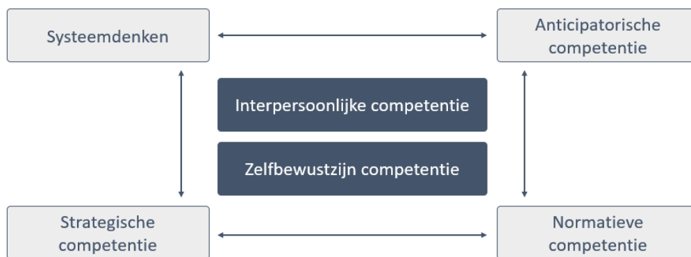
Figuur 1 Systeemdenken: duurzaamheidsuitdagingen en hun complexiteit bekijken; Normatieve en anticipatorische competentie: kritisch zijn; Strategische competentie niet-duurzame elementen aanpassen; interpersoonlijke competentie en competentie zelfbewustzijn: normen en waarden ontwikkelen. Figuur gebaseerd op ("Onderwijzen VOOR duurzaamheid," 2021)

Figuur 1 geeft de duurzaamheidscompetenties weer. Deze kunnen gelinkt worden aan de nieuwe eindtermen in het secundair onderwijs. Bijvoorbeeld: leerlingen moeten "inzicht ontwikkelen in de bouw, structuur en eigenschappen van materie in levende en niet-levende systemen". Dit sluit aan bij de duurzaamheidscompetentie systeemdenken ("Onderwijzen VOOR duurzaamheid," 2021; Vlaanderen, 2022).