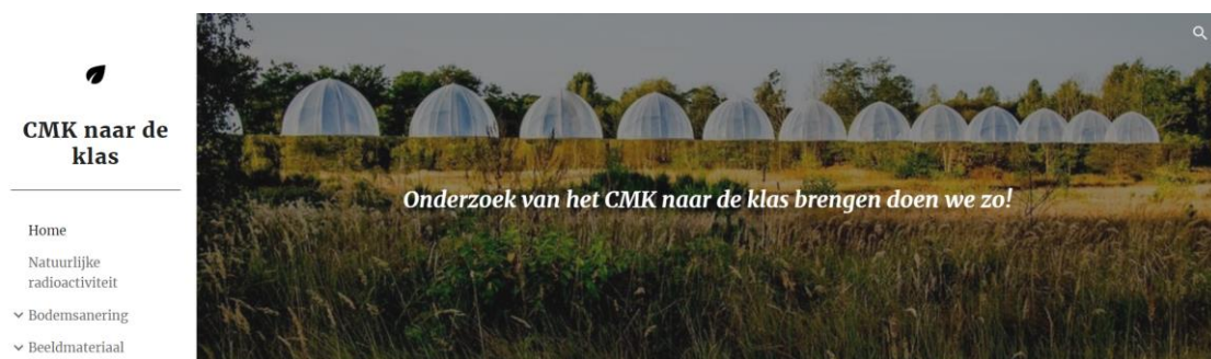
Figuur 5 Homepagina van de ontwikkelde website.

Met de input van de focusgroep werd lesmateriaal ontwikkeld. Dit lesmateriaal werd vervat in een website om deze op een duurzame manier aan te bieden.