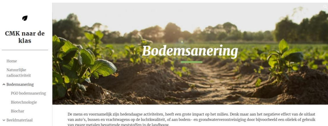
Figuur 6 Pagina bodemsanering van de ontwikkelde website.