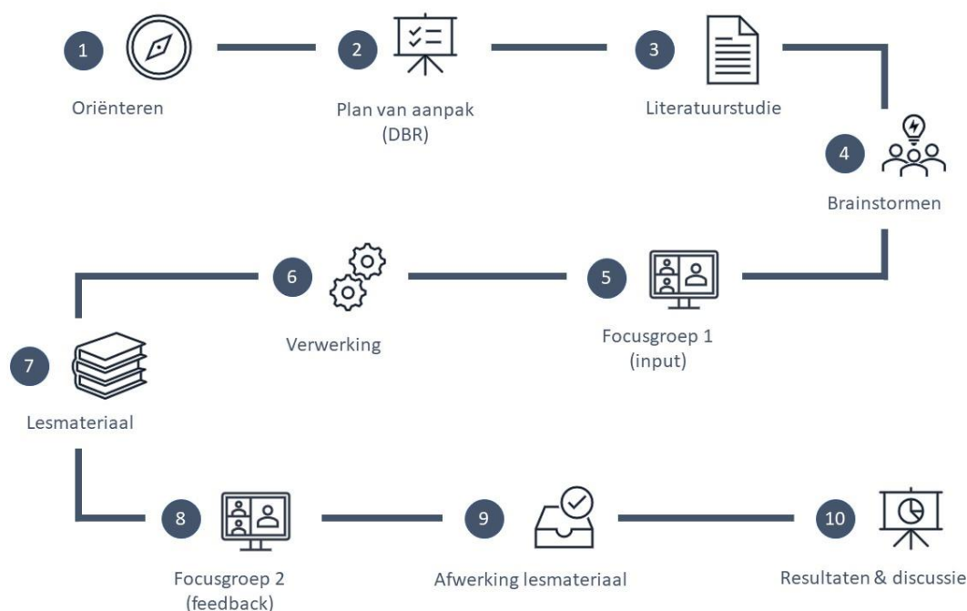
Figuur 2 Visualisatie van het stappenplan dat gevolgd werd tijdens deze masterproef.

Gedurende de masterproef werd het stappenplan in figuur 2 doorlopen.