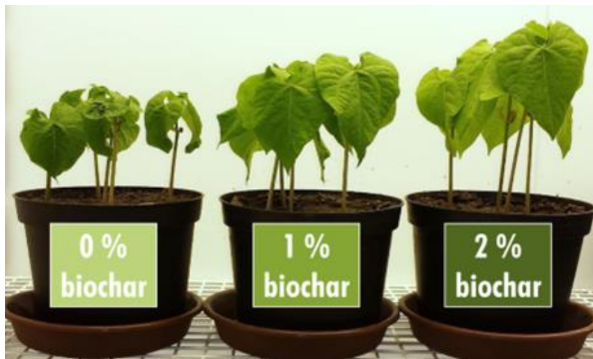
Figuur 9 Enkele afbeeldingen van het ontwikkelde lesmateriaal.