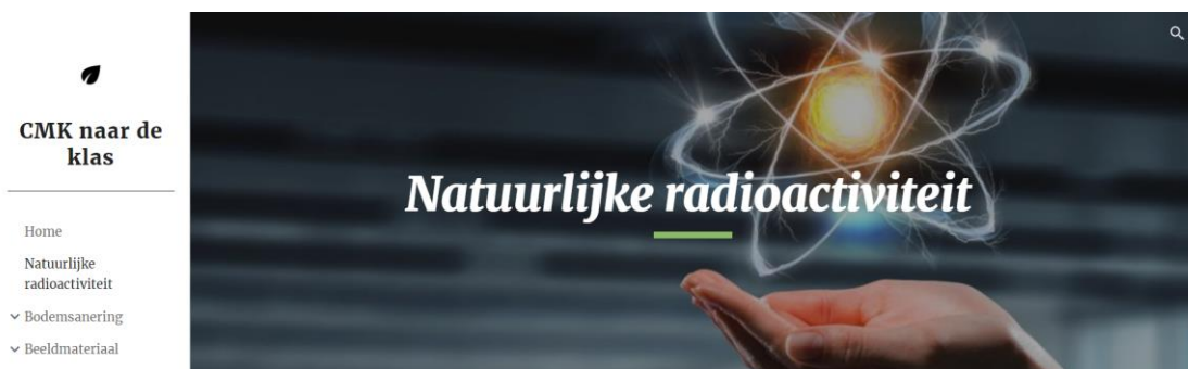
Figuur 8 Pagina natuurlijke radioactiviteit van de ontwikkelde website.