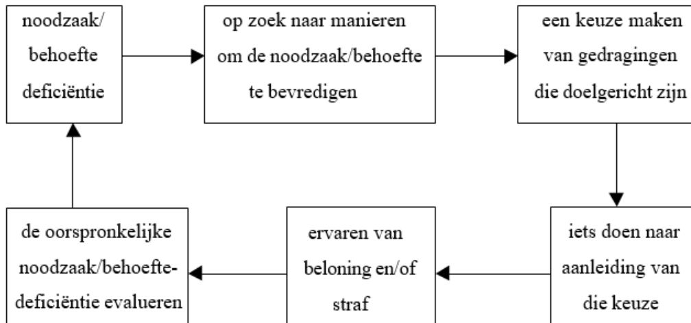
Figuur 1: Onderdelen van het motivatieproces (Maud, 2002)

Motivatie kan worden omschreven als een continu proces. De essentiële onderdelen van dit motivatieproces worden weergegeven in Figuur 1.