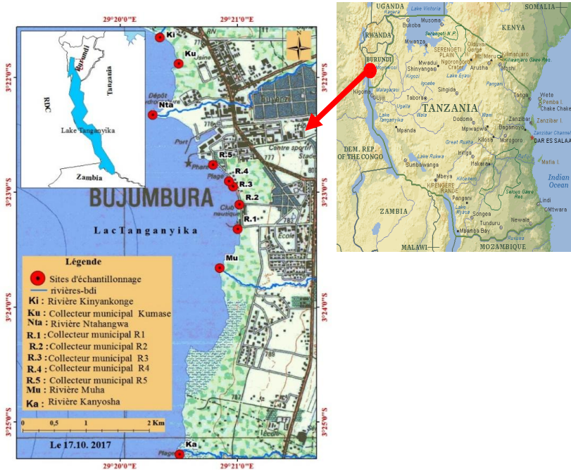
Figure 1: Localisation des sites d'échantillonnages aux alentours de Bujumbura.