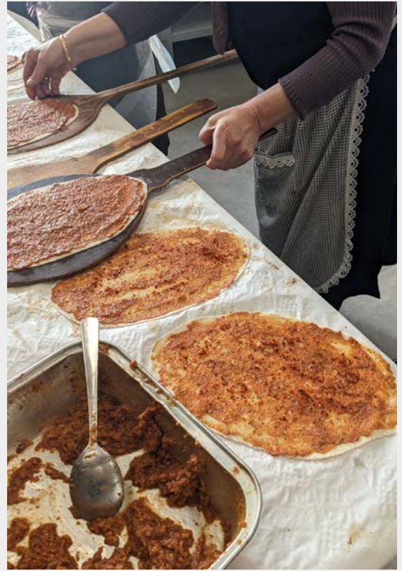
Figura 2: Conocer el lugar a través del gusto. Elaboración de lahmacun en la mezquita.

El giro hacia la intimidad permitió obtener resultados que iban más allá de las necesidades de estacionamiento y que se enfocaron en espacios de cuidado para reparar las relaciones entre humanos y naturaleza, abriendo el dominio público a formas pluriversales de vida (Escobar, 2018). Las ideas incluyeron áreas para comer al aire libre donde las personas vecinas eran invitadas a probar el lahmacun, y espacios de encuentro donde las jóvenes musulmanas pudieran cultivar la intimidad y el sentido de pertenencia, amplificando y haciendo visibles iniciativas y personas que de otro modo permanecerían ocultas. Las y los estudiantes también diseñaron zonas de juego en la naturaleza y senderos llenos de castaños y arbustos autóctonos comestibles para reforzar las prácticas existentes de cuidado y, por tanto, reparar la conexión entre el bosque y el barrio.