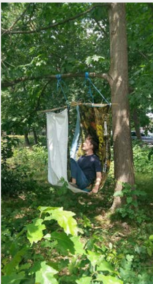
Figura 4: Hamaca en el bosque. Intervención del Live Project en el centro comunitario de Winterslag.

El grupo trabajó mapeando fronteras y barreras, jugó con las niñas y los niños y deliberadamente se cohesionó más allá de lo que exigía el proyecto, dedicando tiempo para construir relaciones personales. Como resultado, el grupo procuró reparar el vínculo entre vecinas y vecinos y el bosque de brezales circundante, creando espacios de relajación que permitieran dormir, dignificando así el descanso en un entorno público. Además, las y los estudiantes decidieron tejer una hamaca como proyecto final. Esta tarea requiere que los cuerpos estén presentes, trabajando juntos y cerca unos de otros, lo que permitió al grupo reforzar sus vínculos de amistad y familiaridad. El enfoque de reparación a través de la intimidad permitió a estudiantes, vecinas, vecinos y plantas tejer relaciones corporales sostenidas por el acto de descansar y dormir en público (Figura 4).