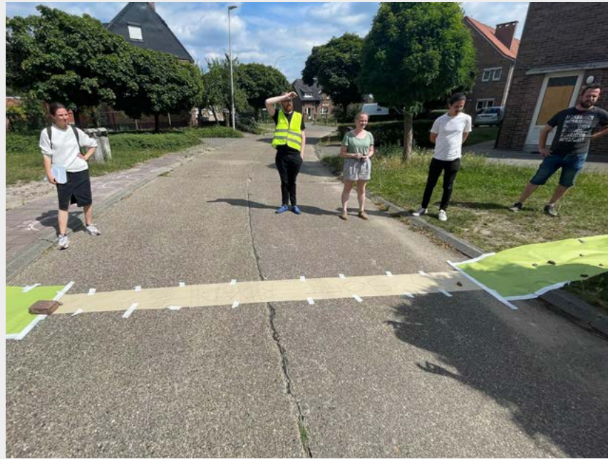
Figura 4: Análisis de los lugares de estacionamiento. Intervención del Live Project para replantear la sección de la calle.

por las calles y sus jardines. Siempre se hablaba de un tema: ¡Necesitamos más espacio para estacionar en nuestra calle! El grupo se encontraba en un choque entre dos mundos: las personas expertas invitadas (arquitectas y arquitectos paisajistas) presionaban a favor de ideas más verdes, sostenibles y de movilidad lenta; al otro lado, las personas residentes pedían más espacio para estacionar. Enfocándose en el prototipado de soluciones para estacionar, las y los estudiantes suscitaron un debate sobre la calle. Sin embargo, no ofrecieron resultados a las agendas opuestas, poniendo en peligro las discusiones sobre otras posibilidades para el lugar.